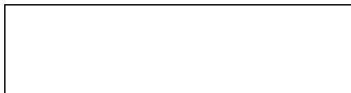
Схема границы балансовой принадлежности

д) границей эксплуатационной ответственности объектов централизованной системы водоотведения исполнителя и заявителя является: